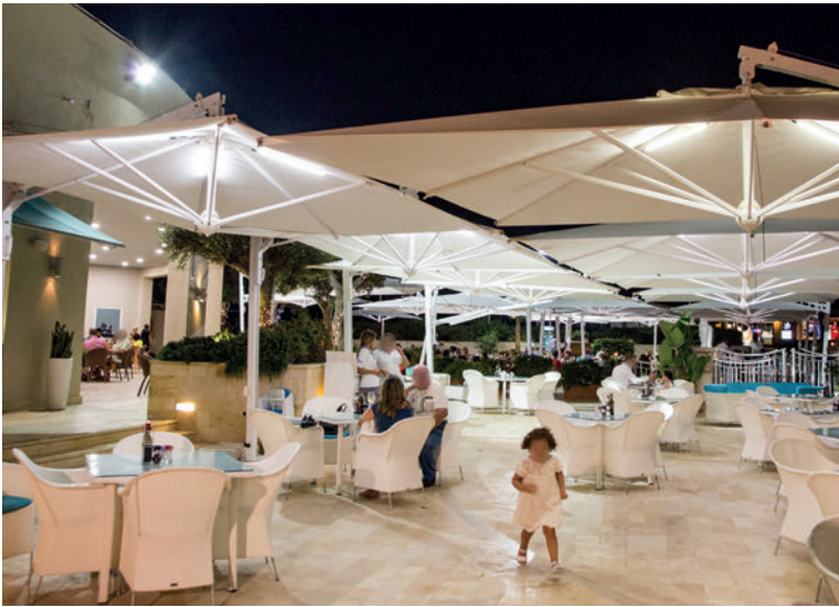
RADISSON HOTEL MALTA