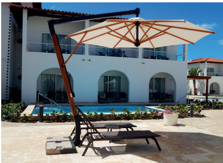
DREAM HOTEL - SANTO DOMINGO