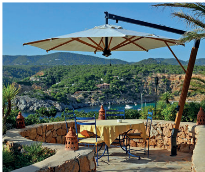
LAS BRIZAS IBIZA - SPAIN