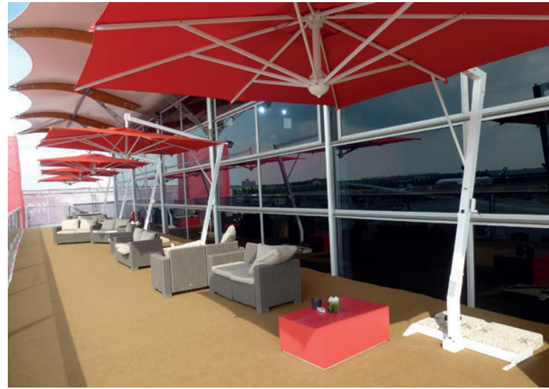
FARNBOROUGH AIRPORT - UK