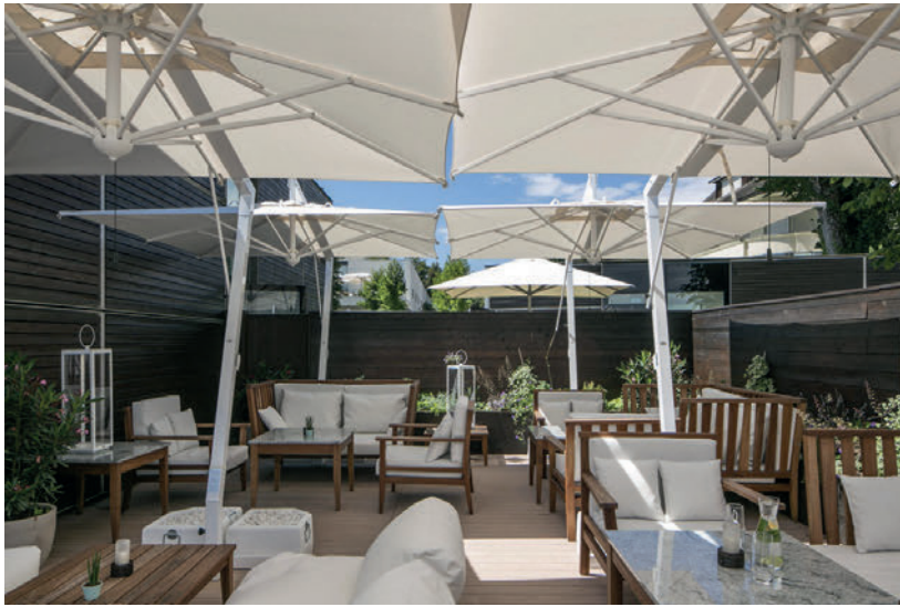
FALKENSTEINER - AUSTRIA